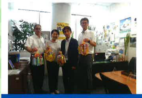
交通安全啓発折鶴贈呈