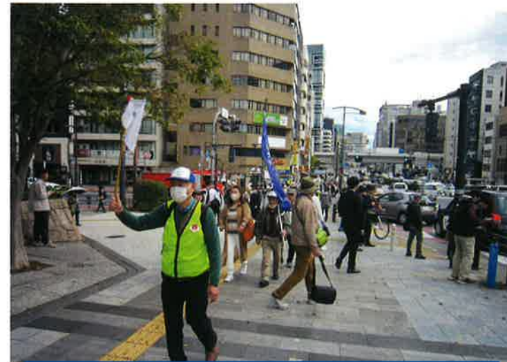
健康ウォーキング