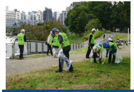
多摩川クリーン活動