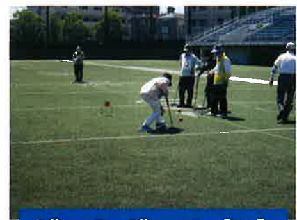
ゲートボール大会